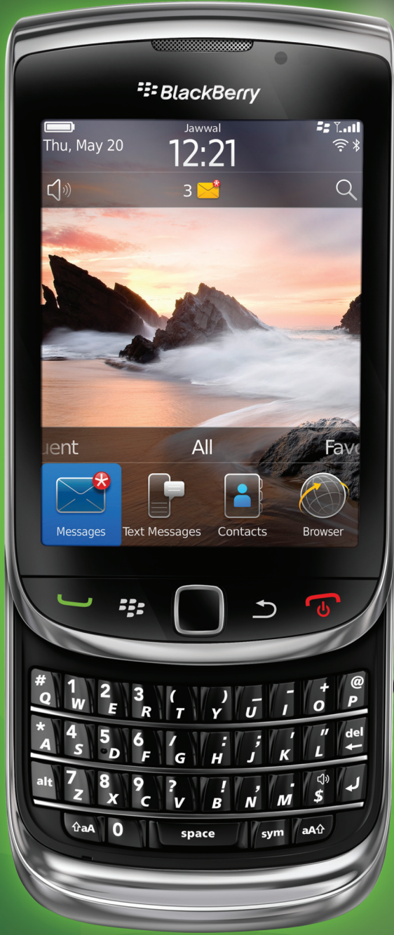
BlackBerry® Torch™ 9800 smartphone