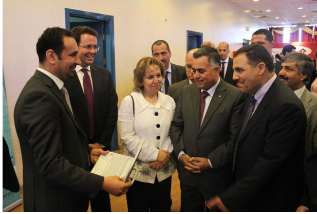
معالي وزيرة الاتصالات وتكنولوجيا المعلومات والسيد هاشم الشوا في معرض إكسبوتك

شهد يوم المؤتمر الرئيسي في ٧ تشرين أول، تواجد متحدثين أعلام في هذا المجال من الشتات، فضلاً عن وجود خبراء دوليين من أنحاء مختلفة من العالم مثل فرنسا وتشيلي والولايات المتحدة الأمريكية وهولندا والنمسا وكوريا وغيرها. ناقش المتحدثون سبل ربط صناعة تكنولوجيا المعلومات والاتصالات في فلسطين مع كل من أوروبا والولايات المتحدة، الفرص المتاحة من خلال دراسة البنك الدولي الأخيرة في الأعمال متناهية الصغر، بالإضافة لوضع التوصيات حول الممارسات الفضلى لربط الأفكار بالتسويق. وقد حضر المؤتمر ٤٦٥ مشاركاً و ٢٠٠ مشارك عبر تقنية الفيديو كونفرنس في غزة. من ناحية أخرى، ركز يوم مؤتمر غزة الذي جرى في ١١ تشرين أول على مناقشة الفجوة بين الأوساط الأكاديمية والقطاع الخاص، وعلى استعراض التحديات التي تواجه البدء بالعمل، وعلى الخبراء المتمرسين في موضوع الحوسبة السحابية والتنقل للاستفادة من الحلول التكنولوجية لربط المتحدثين من مختلف أنحاء العالم بغزة.