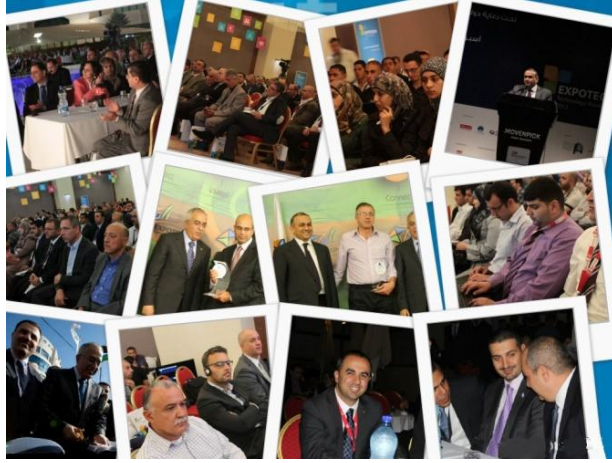
فعاليات أسبوع فلسطين التكنولوجي