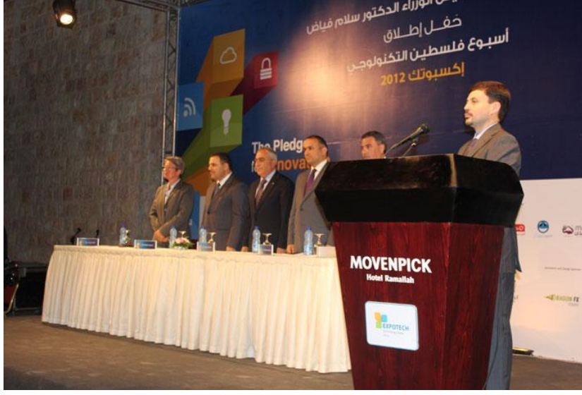
إطلاق أسبوع فلسطين التكنولوجي - ٦ تشرين أول، رام الله

تم تحت رعاية فخامة الرئيس محمود عباس وللسنة التاسعة على التوالي، تم إطلاق أسبوع فلسطين التكنولوجي "إكسبوتك" بنجاح في كل من مدن رام الله وغزة في السادس من تشرين أول، بحضور ٦١٠ (٤٠٠) في رام الله، ٢١٠ في غزة) من أعلام هذه الصناعة على الصعيد المحلي والدولي، ومن داعمي قطاع تكنولوجيا المعلومات والاتصالات في فلسطين. حظي هذا الحدث الذي استمر لمدة أسبوع بدعم كبير تمثل بقائمة طويلة من الرعاية والشركاء من القطاعات العامة والخاصة والبنوك والجهات المانحة.