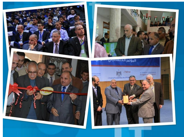
الشراكة مع الجامعات ضمن مشروع التوظيف - غزة