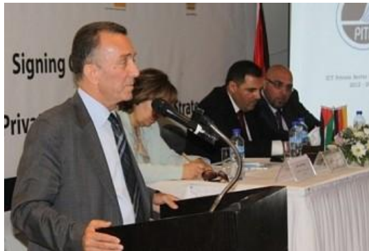
معالي وزير الاقتصاد الوطني خلال حفل إطلاق استراتيجية القطاع الخاص لتكنولوجيا المعلومات والاتصالات

عمل اتحاد بيتا بالشراكة مع الوكالة الألمانية للتعاون الفني GIZ على صياغة واعداد استراتيجية القطاع الخاص لتكنولوجيا المعلومات والاتصالات لتغطي فترة ثلاث سنوات. وقد تم اعداد الاستراتيجية من خلال الاعتماد على منهج تشاركي شامل يضم جميع أصحاب المصلحة ويسمح لهم بالمساهمة في هذه الاستراتيجية. صممت الاستراتيجية الوطنية لتكون بمثابة خارطة الطريق للثلاث سنوات القادمة للعمل على تشجيع نمو وتطور قطاع تكنولوجيا المعلومات والاتصالات الفلسطيني وذلك من خلال التركيز على المحاور التالية: