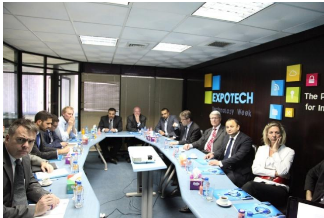
مكتب غزة الجديد

وتحتل مشاركة بيتا في منتدى "الشرق الأوسط وشمال إفريقيا لتكنولوجيا المعلومات والاتصالات" أهم الانجازات التي قام بها الاتحاد للترويج للقطاع على مستوى المنطقة، والمساهمة في وضع فلسطين على خارطة العالم لتكنولوجيا المعلومات والاتصالات. فقد قام الاتحاد من خلال ممثليه من أعضاء مجلس إدارة وطاقم تنفيذي بعرض قدرات القطاع ونجاحاته المختلفة لمشاركي المنتدى من المنطقة والعالم.