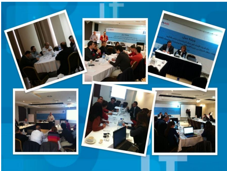
ورشة عمل المناصرة وحشد التأييد