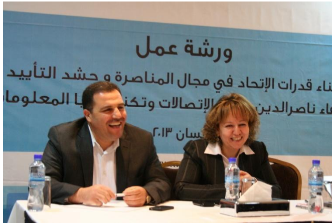
معالي وزيرة الاتصالات وتكنولوجيا المعلومات مع رئيس مجلس إدارة بيتا في ورشة عمل لبناء قدرات الاتحاد في مجال المناصرة وحشد التأييد

لقد تم التركيز في إطار الإستراتيجية الوطنية لتكنولوجيا المعلومات والاتصالات للقطاع الخاص والتي تم تطويرها مؤخراً من قبل اتحاد بيتا لتغطي فترة ثلاث سنوات، على الحاجة إلى تعزيز بيئة الأعمال في مجال تكنولوجيا المعلومات والاتصالات كأحد أهداف الإستراتيجية الرئيسية وذلك بهدف دعم نمو هذه الصناعة. ينطبق هذا بشكل خاص على الحاجة لتطوير البيئة القانونية والتنظيمية وأطر السياسات المتعلقة بقطاع تكنولوجيا المعلومات والاتصالات.