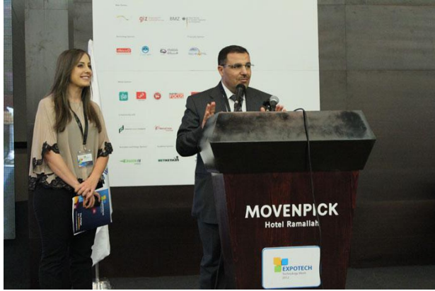
افتتاح المؤتمر التكنولوجي - ٧ تشرين أول

وقد تمحور أسبوع فلسطين التكنولوجي حول العناصر الرئيسية التي شكلت استراتيجية صناعة تكنولوجيا المعلومات والاتصالات - التي تم صياغتها لتغطي فترة ثلاث سنوات - مع التركيز بشكل كبير على تطوير المشاريع ورأس المال البشري وصياغة العلامة التجارية وتعزيز القطاع، بالإضافة لتعزيز المشاركة العملية للجاليات الفلسطينية في الشتات. اشتمل الأسبوع على يوم المؤتمر الرئيسي، وعلى يوم واحد من ورش العمل التي دارت حول الحوسبة السحابية بالإضافة لبعض الأحداث والنشاطات، والأيام التكنولوجية مع شركات عالمية: Cisco, SAP, Oracle, Microsoft, Mixed Dimensions, and Aruba Networks وأخيراً المعرض الذي استمر لمدة ثلاثة أيام والذي ركز على مفهوم خاص جمع تحت سقف واحد جميع اللاعبين في النظام الإيكولوجي لقطاع تكنولوجيا المعلومات والاتصالات. وقد عقدت جميع الأنشطة المذكورة أعلاه في كل من رام الله وغزة.