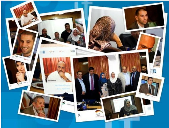
ماجستير إدارة الأعمال المصغر - غزة