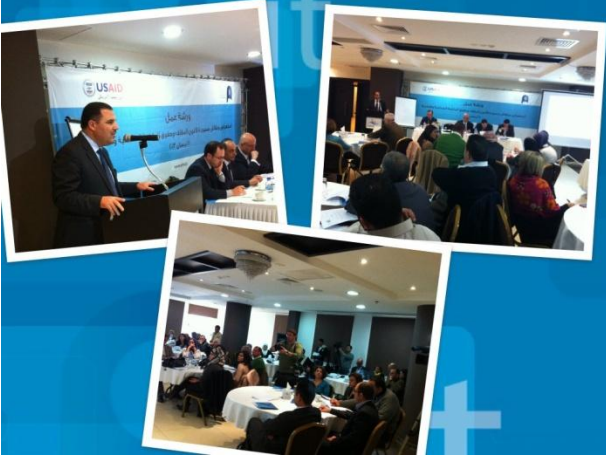
ورشة عمل لقانون حقوق الملكية الفردية