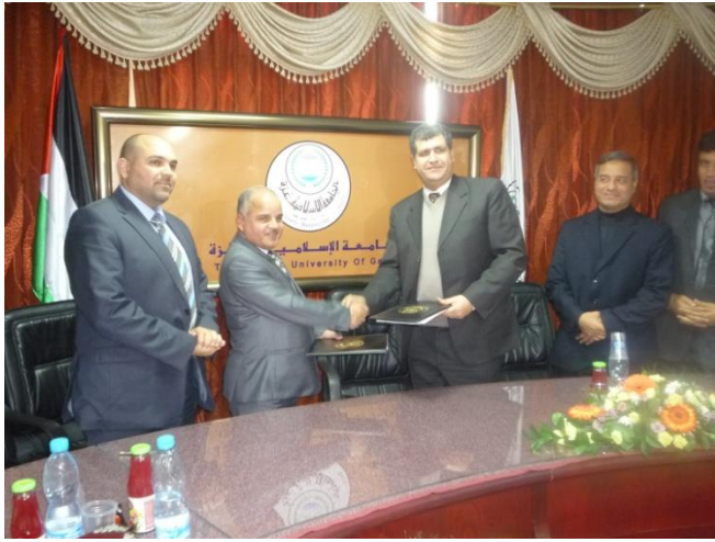
توقيع اتفاقية تعاون بين الجامعة الإسلامية - غزة واتحاد بيتا