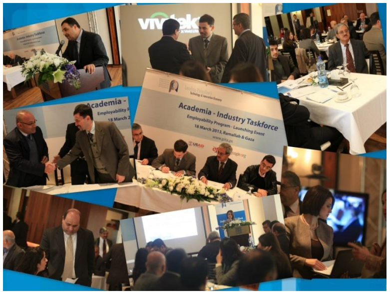
إطلاق مشروع التوظيف