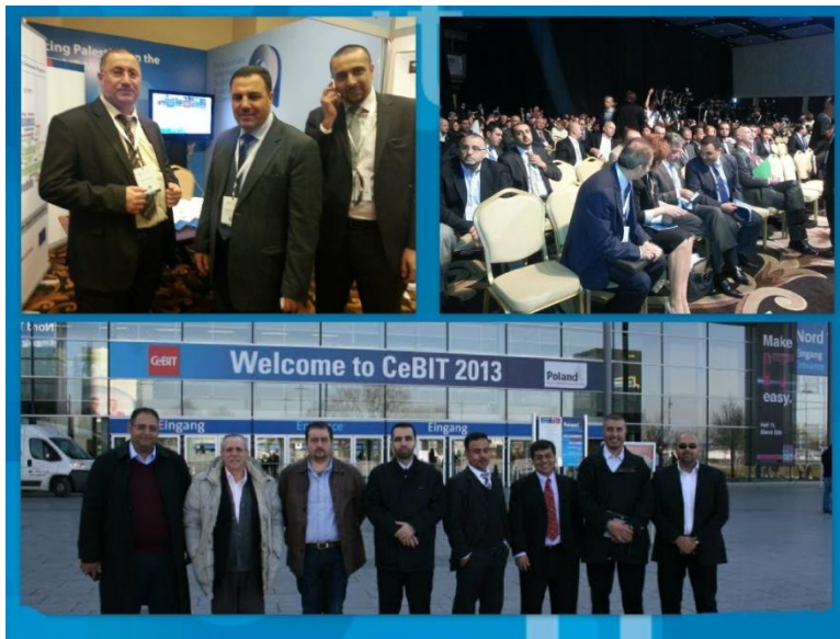
بيتا في سببت ٢٠١٣ و ٢٠١٣ MENA ICT Forum