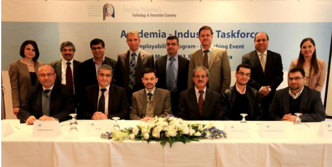
إطلاق برنامج بيتا للتوظيف

إن هذا المشروع سوف يخدم صناعة تكنولوجيا المعلومات والاتصالات (أعضاء بيتا) وقطاع التعليم (الخريجين والطلاب حديثو التخرج) في السوق الفلسطيني (الضفة الغربية وقطاع غزة).