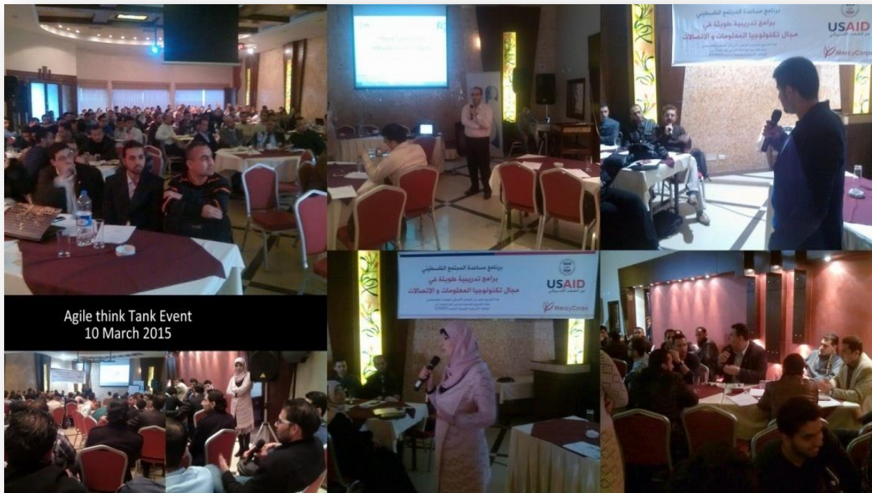
Agile think Tank Event 10 March 2015